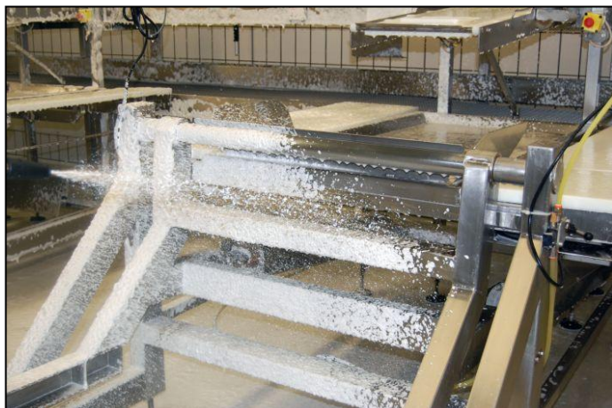
1 Химическое действие

В комплект IdroFoamRinse FOOD входят стандартный шланг 10 метров, катушка для шланга и пистолет для нанесения пены и ополаскивания.