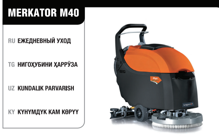
ПОЛОМОЕЧНАЯ МАШИНА MERKATOR M40 МОШИНИ ФАРШШҮЙ MERKATOR M40 POL YUVISH MASHINASI MERKATOR M40 ПОЛ ЖУУГУЧ МАШИНА MERKATOR M40

RU Все операции должны всегда выполняться при использовании защитных перчаток. TG Ҳамаи амалиётхо бояд доим бо испотидан дастулашхои эҳтиётқонанда иҷро шаванд. UZ Barcha amaliyotlar har doim himoya qo'qolqlaridan foydalanган holda amalga oshirilishi kerak. KY Бардык иштерди коргоочу мээлейерди киийип аткаруу керек. RU Для получения дополнительной информации см. руководство по эксплуатации и техобслуживанию на компакт-диске. Не заменяйте руководство по эксплуатации и техобслуживанию. TG Барои гирифтани маълумоти иловаги ба дастуравали истифода ва нигоҳдорни техник дар компакт-диск ниқарад. Дастуравали истифода ва нигоҳдорни техникро иваз намоед. UZ Qo'shimcha ma'lumot uchun kompakt-diskdagi ishlatish va texnik xizmat ko'rsatish qo'llanmasiga qarang. Ishlatish va texnik xizmat ko'rsatish qo'llanmasining o'rni ni bosmaydi. KY Кошумча маълумат алуу үчүн компакт-дисктеги пайдалануу жана техникалык тейлөө боюнча нускаманы караңыз. Пайдалануу жана техникалык тейлөө боюнча нускаманын ордун басыпай.