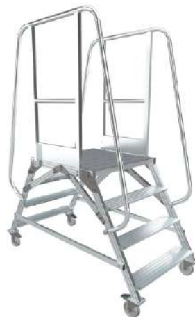
МПА - У