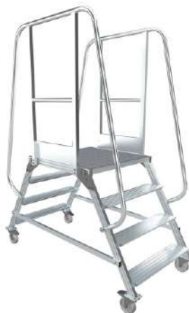
МПА - 2

Ограждение с одной стороны с возможностью перестановки на другую сторону