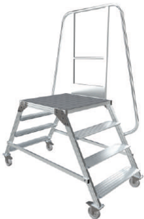
МПА - 1

Обеспечивает переход над конвейерными лентами и производственными линиями. Используется как в помещениях, так и на открытых площадках. Применяется для обслуживания различного оборудования на производстве, в магазинах, складах.