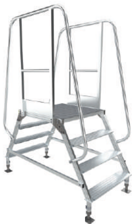
МПА - Р