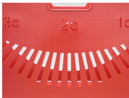
Перфорация обеспечивает циркуляцию воздуха