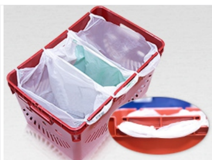
Специальные пазы для закрепления 3 пакетов

Специализированные ящики с держателями для продуктовых пакетов