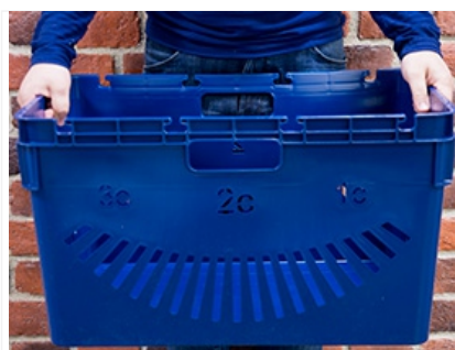
Ручки для переноски на каждой стороне ящика