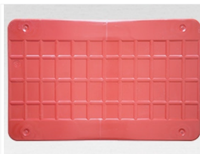
Дно подходит для работы на рольгангах