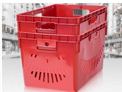
Пустые ящики вкладываются друг в друга